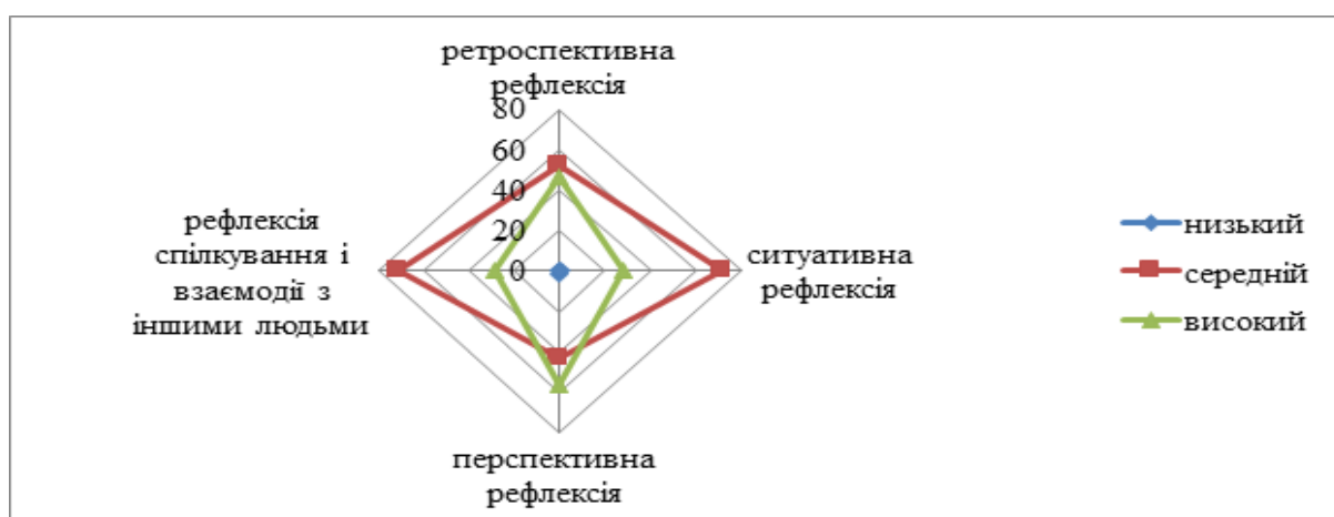
Рисунок 2.2 – Показники спрямованості рефлексивності у майбутніх психологів